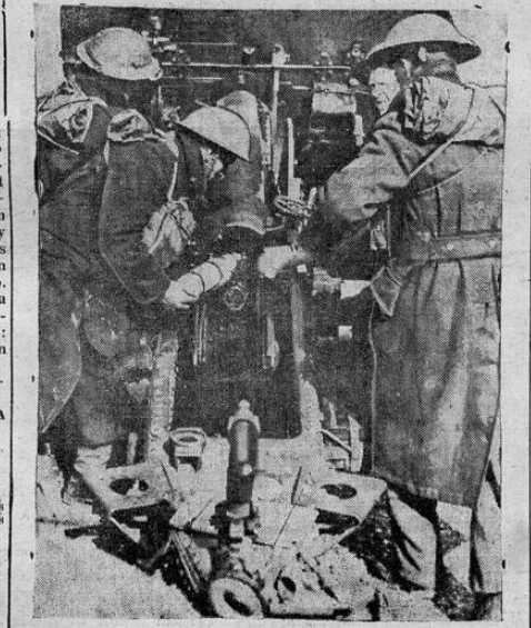
LAS MANIOBRAS MAS IMPORTANTES CELEBRADAS EN INGLATERRA DESDE LA GUERRA

WASHINGTON, 19. UP. Norman Devel, el correspondiente de la United Press que tuvo a su cargo en Moscú las informaciones relativas a la guerra ruso-finlandesa, declaró hoy en una conversación ante la sociedad americana de editores de periódicos que los dirigentes soviéticos temen que los aliados ataquen a Rusia como consecuencia de la propagación de la guerra a Escandinavia. "Mi experiencia me indica, dijo que los líderes moscovitas anticipan un ataque de las potencias capitalistas en un intento para destruir el comunismo, si Europa no queda demasiado extenuada del presente conflicto. Como se recordará, los rusos dicen como una de las razones principales para desear el Istmo de Karén la necesidad de cerrar la ruta terrestre hacia Leningrado para protegerse contra la agresión siempre latente de las democracias occidentales". Respecto de la guerra de Finlandia Ovel expresó que los rusos estaban firmemente convencidos de que los finlandeses simpatizan con las ideas soviéticas y fueron los más sorprendidos al encontrarse una resistencia tan inesperada como difícil de vencer.