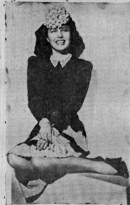
ROSALINDA LUCE LINDA COMO UNA ROSA

Pronto: Torre de Londres, Calles de San Espada, Pinedocho, Mucho Denonzo, Suspiros de España, etcétera.